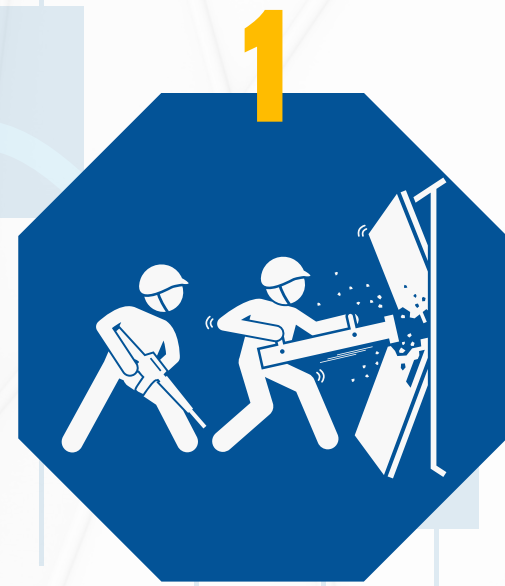
اقتحام مراكز طبية