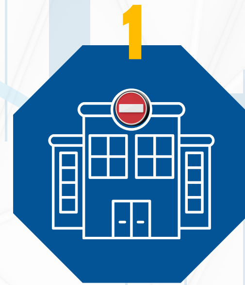
حصار مراكز طبية