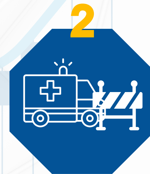
اعاقعة عمل طواقم طبية