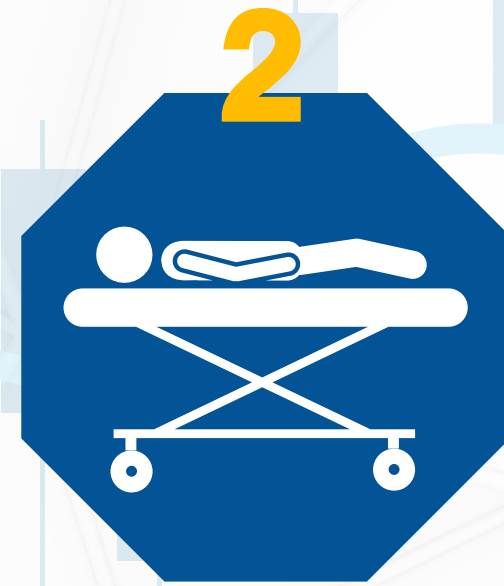
اصابة طواقم طبية